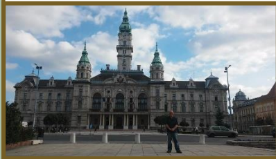
גייר, הונגריה. סוכות תשע"ה

כל כֶּה יִפֶּה הַיָּא גִּייר, עיר הַלְדֻתָה שֶׁל אַמִּי פִּינֶה אוֹסְטְרוֹ-הוֹנְגְרִית. לא נִפְגְּעָה כֶּלל בַּמְלַחְמָה הַגְּדוֹלָה. כָּאן, בְּבֵיתִי הַקָּפָה סִבְתָּא שְׁלִי, דוֹדֵי וְיִלְדֵיהֶם אֶכְלוּ עוֹגוֹת דוֹבוֹשׁ טִילוּ בְּרַחוּבוֹת הַנְּאָסְפִים אֶל כֶּפֶר הָעִיר וְכִמּוֹתָם גַּם הֵם נֶאֱסְפוּ וְנִשְׁלְחוּ (לְפִי הַרְשׁוּמוֹת) בִּ11 אוֹ בִּ14 בְּיוֹנֵי 1944.