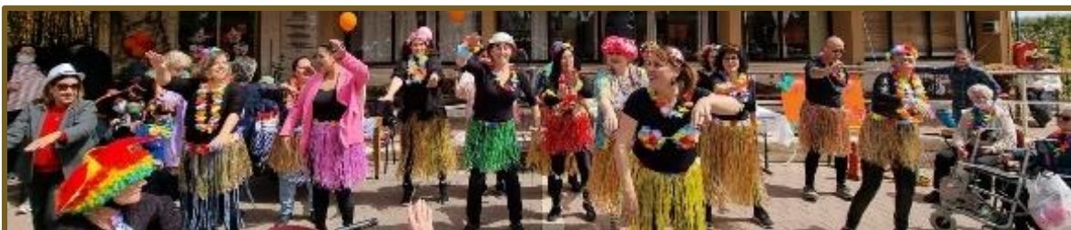
ריקוד בהפתעה של הצוות בחגיגות פורים