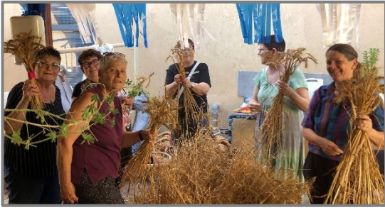
פעילות שבועות – קהילה תומכת תודה למתנדבים בהכנות ובפעילות